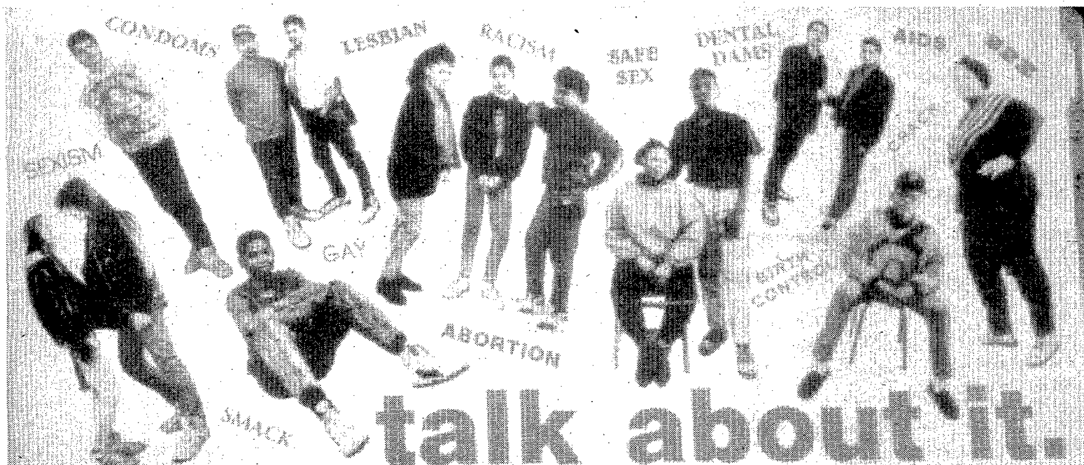
“Your message here”, valla publicitaria de Group Material, colocada en Chicago en 1990