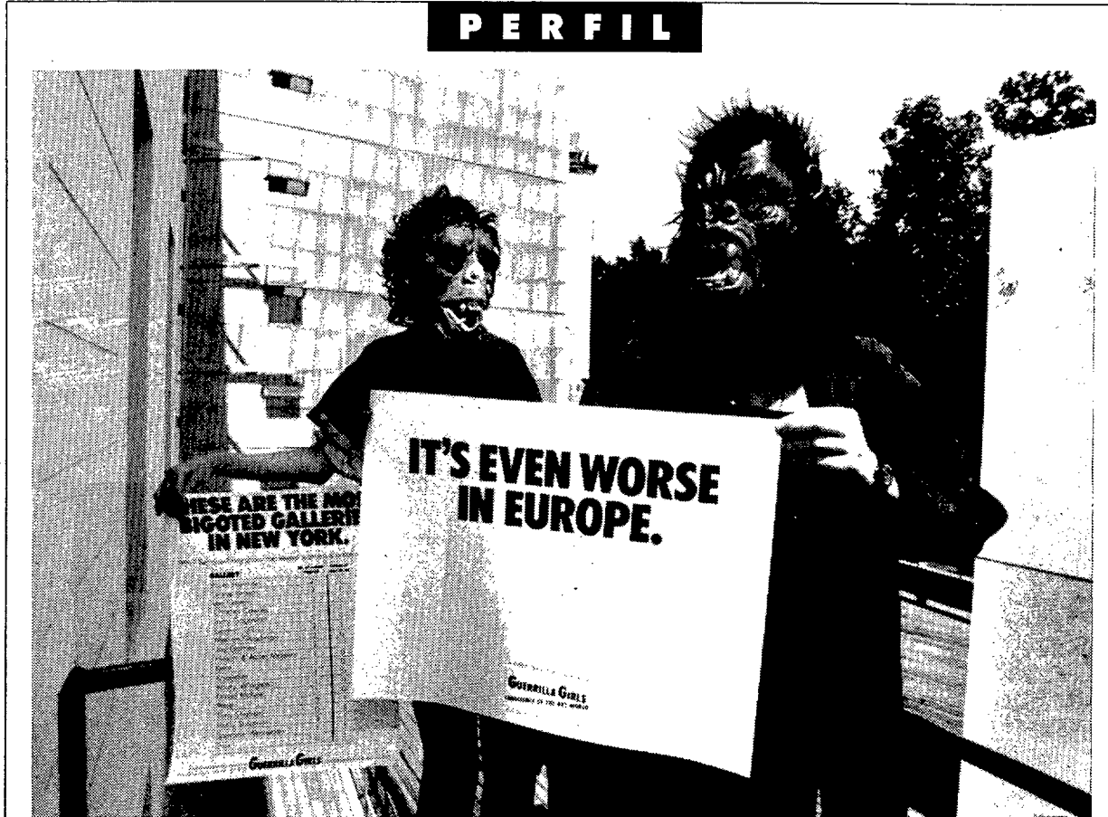
La Guerrilla denuncian la nula presencia de mujeres en las salas de Nueva York, pero “en Europa es peor”

—Nos las quitaremos cuando el 51 % de la población sean componentes de Guerrilla Girls. Aunque es bastante estúpido ponerse una