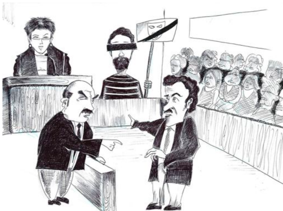
Los dos abogados argumentan durante la vista.

Romilar- ¿Y le parece mal o le parece bien?